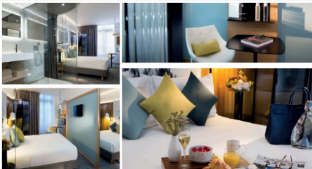
Selection de chambres du Drawing Hotel, à partir de 240 euros / nuit

“ Le Drawing Hotel est parti d'un désir : promouvoir plus encore le dessin contemporain, explique Carine Tissot [...] Nous voulons faire vibrer notre établissement au rythme de la création contemporaine. Nous avons volontairement laissé des zones en 'friche' afin de nous permettre de solliciter des artistes dans les années à venir. Bien sûr, les oeuvres réalisées dans les couloirs de l'hôtel sont pérennes.