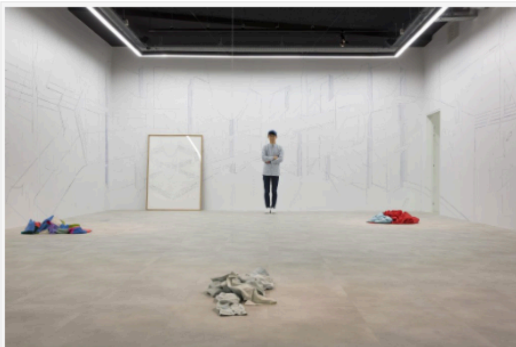
Drawing Lab Paris permet aux artistes d'expérimenter toutes les formes du dessin contemporain